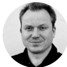
Ask Økland ADVOKAT