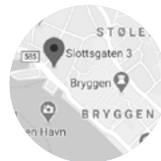
Pelagisk Forening Slottsgaten 3, 5003 Bergen